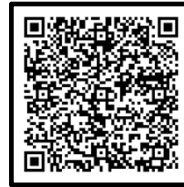
①受診相談センター (厚生労働省HP)